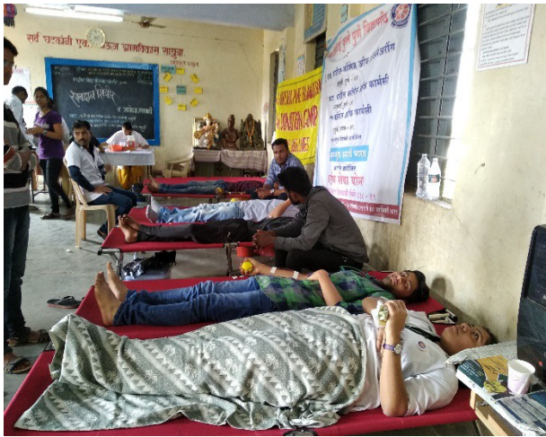
Blood donation camp