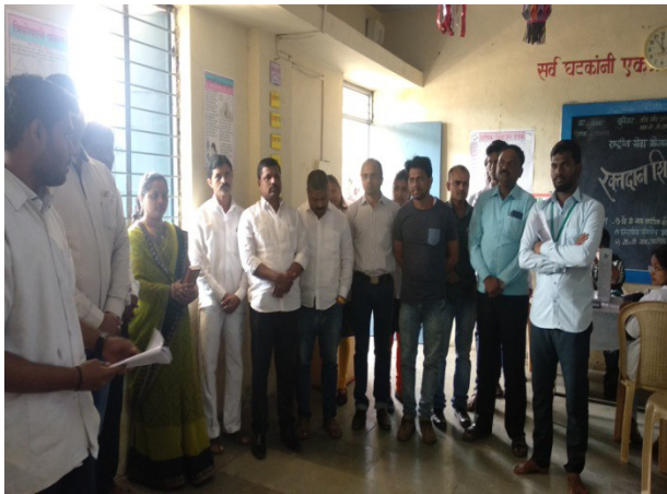
Motivation by Sarpanch and others