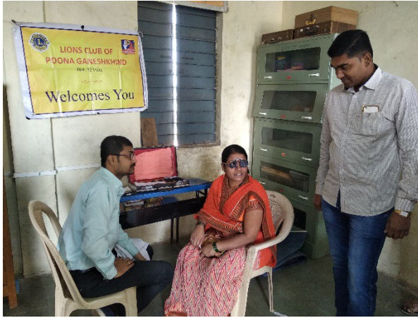
Eye Check up