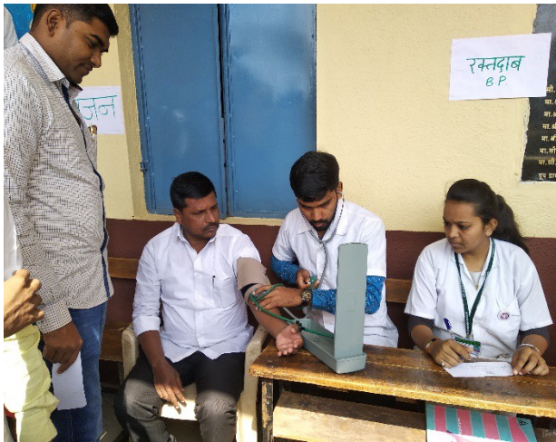
Blood pressure checkup