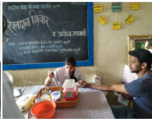
Hemoglobin check up